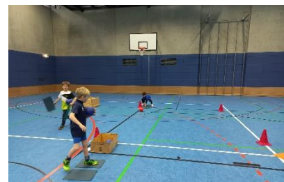
„Biathlon“ mit Teppichfließen als Skier