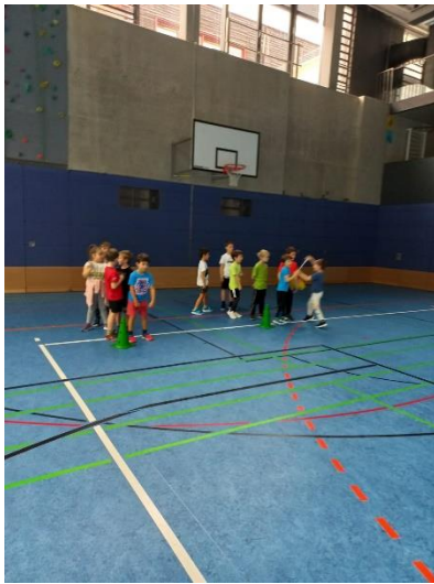
Staffellauf: Wer füllt den Sack des Weihnachtsmannes am schnellsten?

In der abschließenden Gesprächsrunde berichteten die Kinder von den Übungen, die ihnen am besten gefallen haben. Allen hat es großen Spaß gemacht.