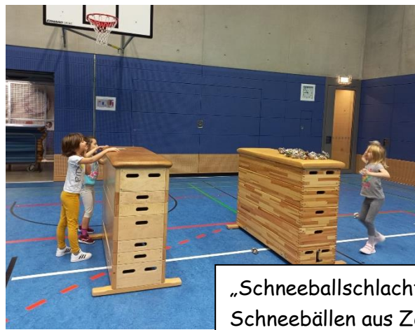
„Schneeballschlacht“ mit Schneebällen aus Zeitung