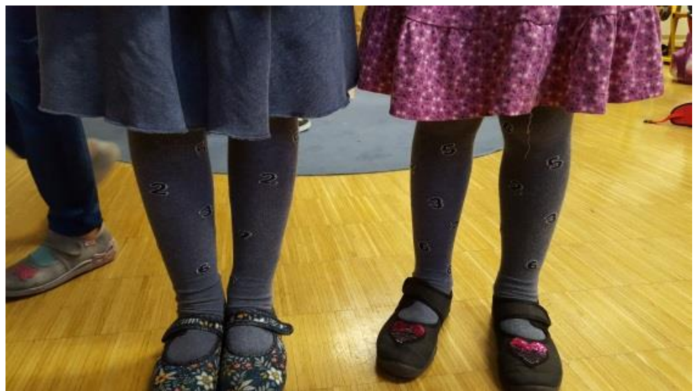
passend gekleidet ...