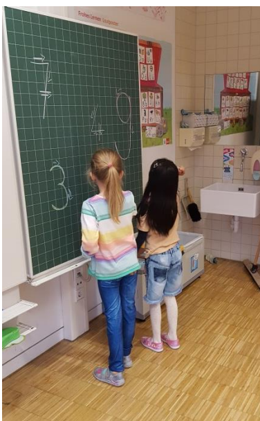
Zahlen an der Tafel schreiben